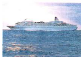
クルーズ初体験に最適な「飛鳥」のワンナイト・クルーズ。

「飛鳥」ワンナイト・クルーズ ●一九九八年十一月七日(土)～八日(日) 時間 十一月七日午後四時より東京・晴海埠頭にて乗船 十一月八日午後二時三十分同埠頭にて下船(予定) 料金 七万円(Jステートルーム)～二十二万円(Sロイヤルスイート) ドレス・コード(ディナー) フォーマル *価格は、クルーズ代、宿泊代、三回の食事代を含む一名様料金(税別)です。バーなどでの飲食は個人清算となりますのであらかじめご承知ください。 *シングルユース(価格の三〇パーセント増し。S、A、B、Cタイプの一部を除く)もご利用いただけます。