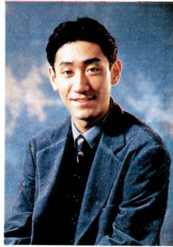
今回は姉・光江とともに息の合った舞いを披露してくれる中村橋之助。

セブンスーズの創刊10周年を記念して開催される「飛鳥」のワンナイト・クルーズをご案内します。数あるスペシャル・プログラムの中でもいちばんの注目を集めて