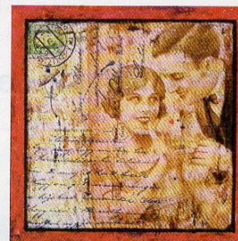
» Drága Mancika, 2010

Anton Molnár hedonista művész. Nem úgy, mint a Satyriconból ismert Trimalchio, a vagyonában féktelenül tobzódó római úrgazdag, hanem miként Krúdy hőse, Szindbád, az utazó. Nem duhaj habzsoló, hanem szemlélődő inyenc. Az izek és illatok, a női szépség feltétlen csodálójá, benyomások gyűjtője. Életképek, emlékek lenyomata kerül a vásznonra. Saját élmények-e vagy inkább a nézők vágyai? Nem fontos. Utazunk korokon át a középkortól a Monarchia fürdővilágáig, a hatvanas évek gyermekjétekeitől a mai metropolisok villódzásáig. Utazunk