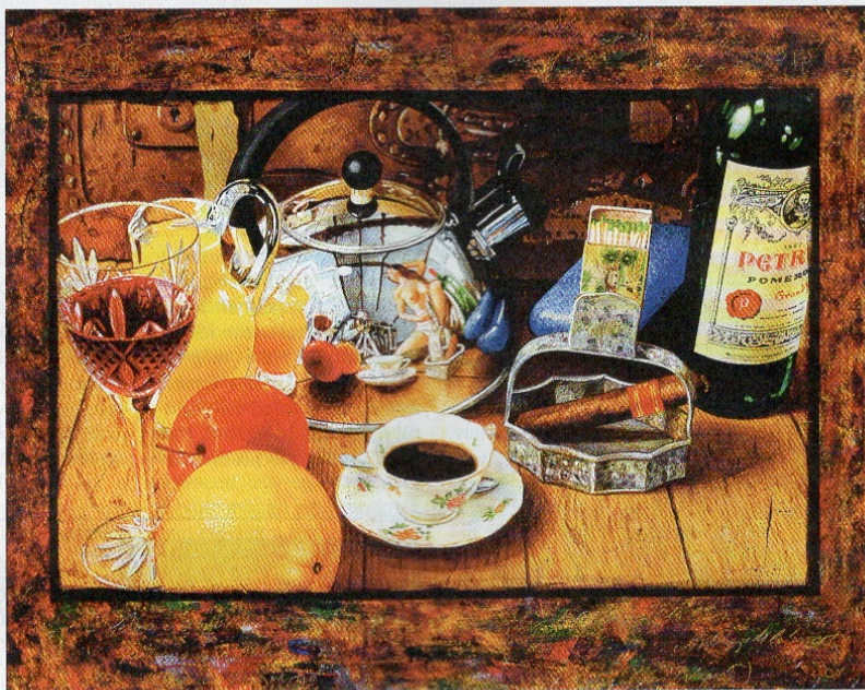
» Petrus a műteremben, 2010