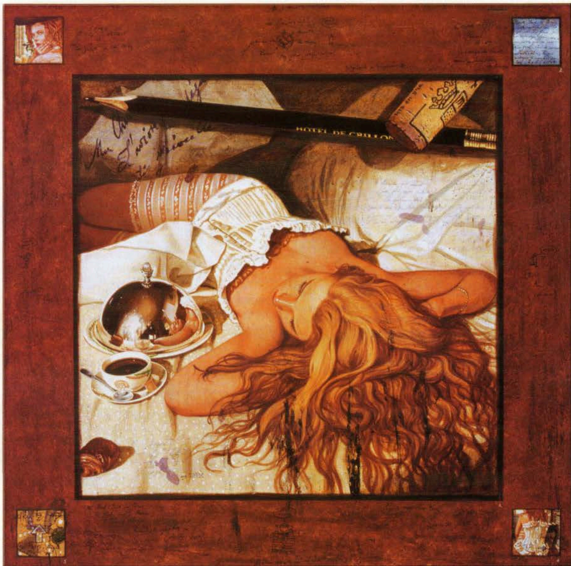
PETRUS, MARGAUX, MOUTON

kiállító galériák segítségével okosan épít tovább. Műhely-otthonában csak készülő alkotásokkal lehet találkozni, a gyűjtők folyamatosan és szenvedélyesen követik az új képek születését. Így a művek szinte azonnal másnál élnek tovább életüket, egyéni gyűjteményekben vagy közterekben, mint például a párizsi Hotel de Crillonban, vagy Mauritius szigetén a Royal Palm szállodában. A művész egyik eddigi legizgalmasabb szakmai találkozása a közelmúltban elhunyt Balthus műhelyében történt, akinek munkájában és filozófiájában azt tisztelte a legjobban, hogy mindig kitartott saját szemlélete és a világról alkotott művészi véleménye mellett. Kí-