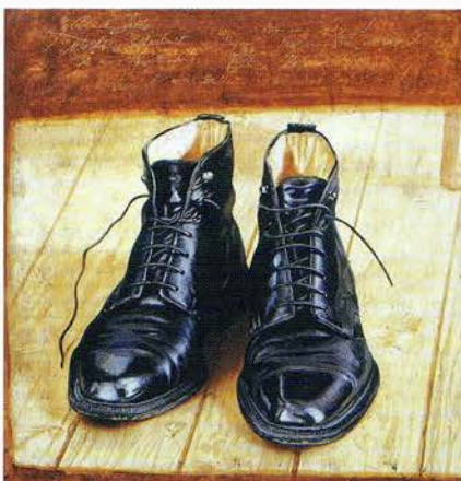
A fekete cipőim, 2001, olaj, vászon 80 x 80 cm

Az önarckép megjelenési formái is különbözők, gyakran a hagyományos értelemben vett önportré, máskor a műteremben dolgozó, olykor egészen a háttérbe helyezve ábrázolt figura képviseli a művészt, s az is előfordul, hogy a kalap – a festő egyik legszemélyesebb tárgya, viseleti darabja – képviseli gazdáját a kompozícióban. Akárhogyan is van, amit látunk, az az egyik oldalon igen határozott alakot kap, a fotórealizmus tanulságainak hasznosítására, a 16–17. századi németalföldi festészet tanulmányozására egyaránt utal, ha úgy tetszik, az objektív, a személytelen, a szenttelen ábrázolásmód eszközeként. A másik oldalon viszont minden tárgyat, személyt, minden kompozíciót valamilyen különös nosztalgia jellemez, az időben-térben távoli, elérhetetlen, de a tudatban, az érzelmekben mégis jelenlévő értékek utáni vágy, ami a jelenvalóság érzete mellett a jelenen kívüli-