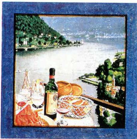
コモ湖全景 51×51cm ジクレー ¥190,000