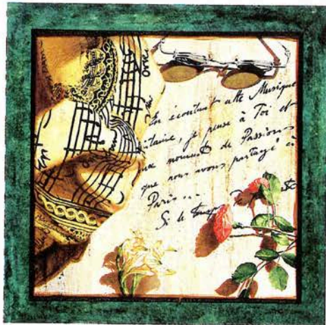
パリからの手紙 51×51cm ジクレー ¥190,000