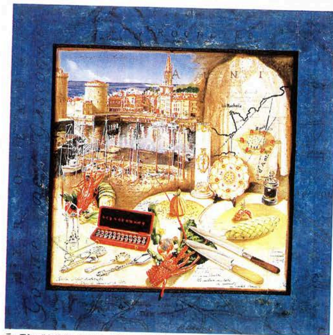
ラ・ロシェルに捧ぐ 70×70cm ジクレー ¥180,000

フランスの鉄人・坂井宏行氏のレストラン「ラ・ロシェル」の20周年を記念して描下ろした特別限定版画。作品には店名の由来となったフランスの港町ラ・ロシェルの風景と共に、坂井氏ゆかりの品々がモチーフとして描かれています。