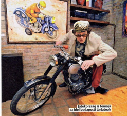
Játékosrajg is témája az idei budapesti tárlatnak