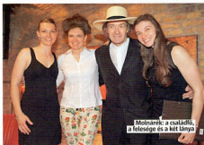
Molnárak: a család, a felesége és a két lánya

1983-ban. Az első franciaországi kiállításomon már 2000 frankért, olyan 80 ezer forintért vásároltak tőlem festményt. Ma 15 és 30 ezer euró között mozognak az áraim. De ez nem mondt semmit, hisz Van Gogh életében egyetlen képet adott el, azt is a testvérének. Napjainkban sokkal többet fizetnek érte az aukción.