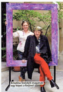
Krisztina festette magát egy képet a férjével

Az árak nem én határoztam meg, hanem a piac, a galériák. Budapesten sem adhatok olcsóbban egy festményt, mint Londonban. Ötödéven a főiskolám megfestettem Keith Richards, a Rolling Stones gitárosának portréját – emiatt ki akartak rúgni. Molnár György barátom, akivel közösen alapítottuk a budapesti galériát, megvette a képet 2000 forintért.